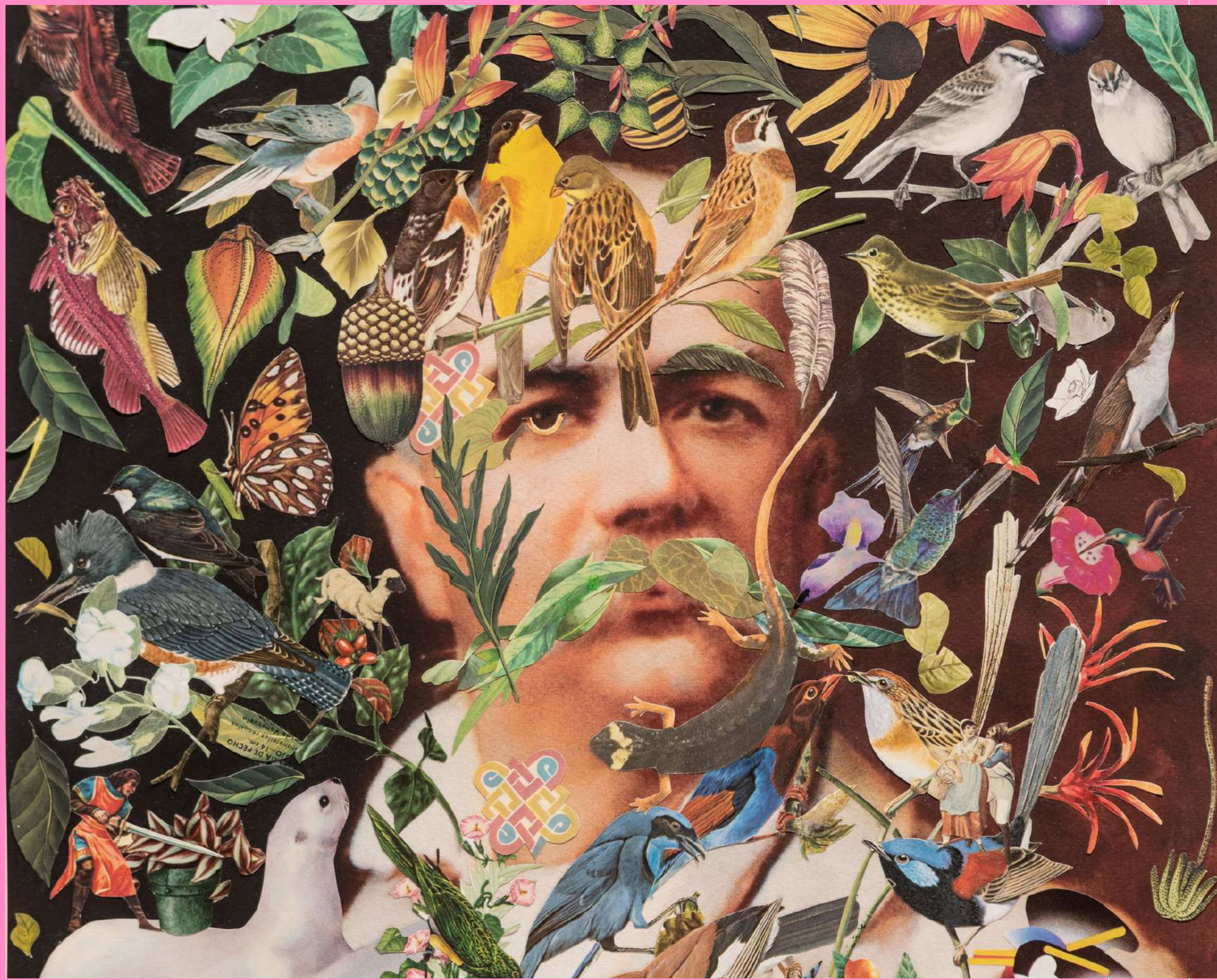
Ilustración: Mauricio Garrido. Colección "Vicuña Mackenna Revisitado".